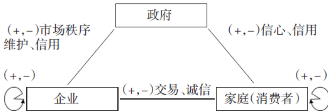
图 1 组织—规则—关系(信任)的反馈网络